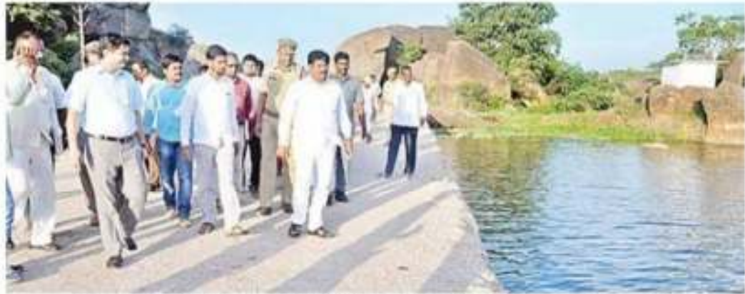
చెరువుల వద్ద నిమజ్జన ఏర్పాట్లను పరిశీలిస్తున్న మేయర్, కమిషనర్, ఇతర అధికారులు